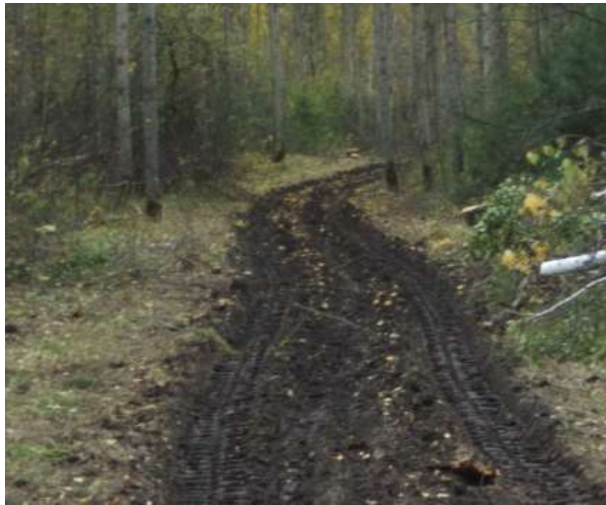
Рис. 18 Лесная дорога, пересекающая лесосеку, используемая в качестве трелевочного волока.