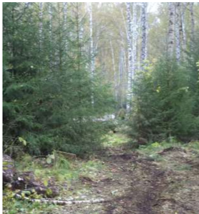
Рис. 19 Междурядье лесных культур, используемое в качестве волока

Волоки бывают магистральные и пасечные (рис. 70).