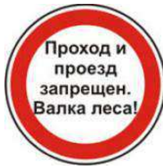
Рис. 16 Предупредительный аншлаг