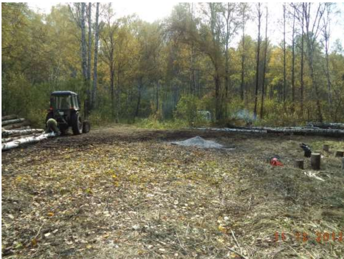
Рис. 17 Погрузочный пункт